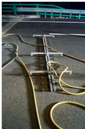
prémontage EJ 50 S