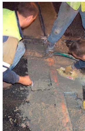
mise en œuvre du BETEC DSP 343 à prise rapide