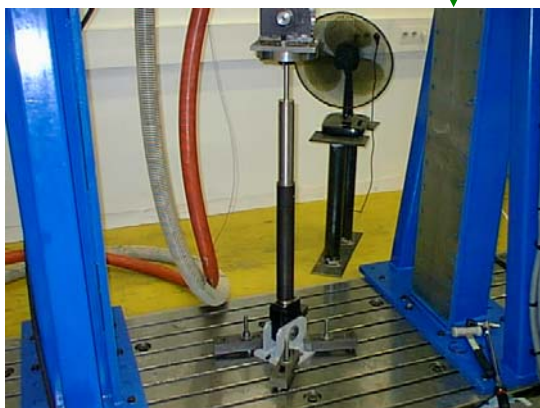
↓ Amortisseur ASR 50 - 300 C